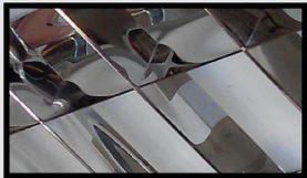
/P: Chóa phản quang hình Parabol & thanh ngang Parabol